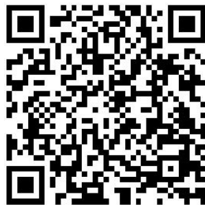
商洛市人民政府领导班子成员信息

备注：市政府领导班子成员信息可在商洛市人民政府门户网站（ http://www.shangluo.gov.cn/ ）上查阅。