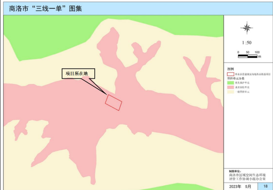
图 1-1 商洛市生态环境管控单元分布示意图

根据陕西省生态环境厅办公室关于印发《陕西省“三线一单”生态环境分区管控应用技术指南：环境影响评价(试行)》的通知（陕环办发〔2022〕76号）、《陕西省人民政府关于加快实施“三线一单”生态环境分区管控的意见》（陕发〔2020〕11号）、《商洛市人民政府关于印发商洛市“三线一单”生态环境分区管控方案的通知》（商政发〔2021〕22号）以及商洛市生态环境管控单元分布示意图，项目所在区域属于重点管控单元，项目与商洛市生态环境管控单元分布关系示意图见图1-1，本项目与“三线一单”符合性分析见表1-3。