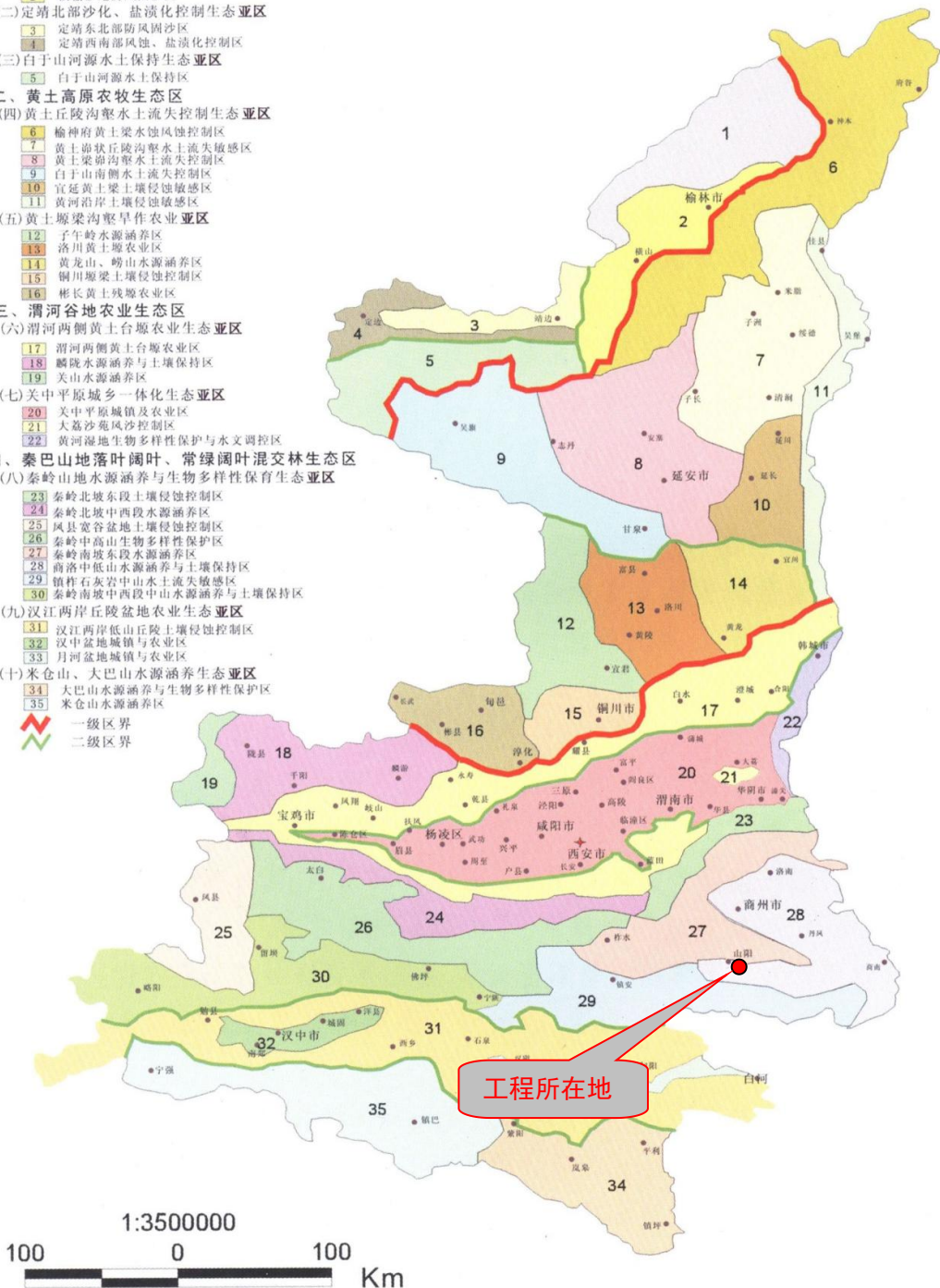
图 3-1 陕西省生态功能区划图