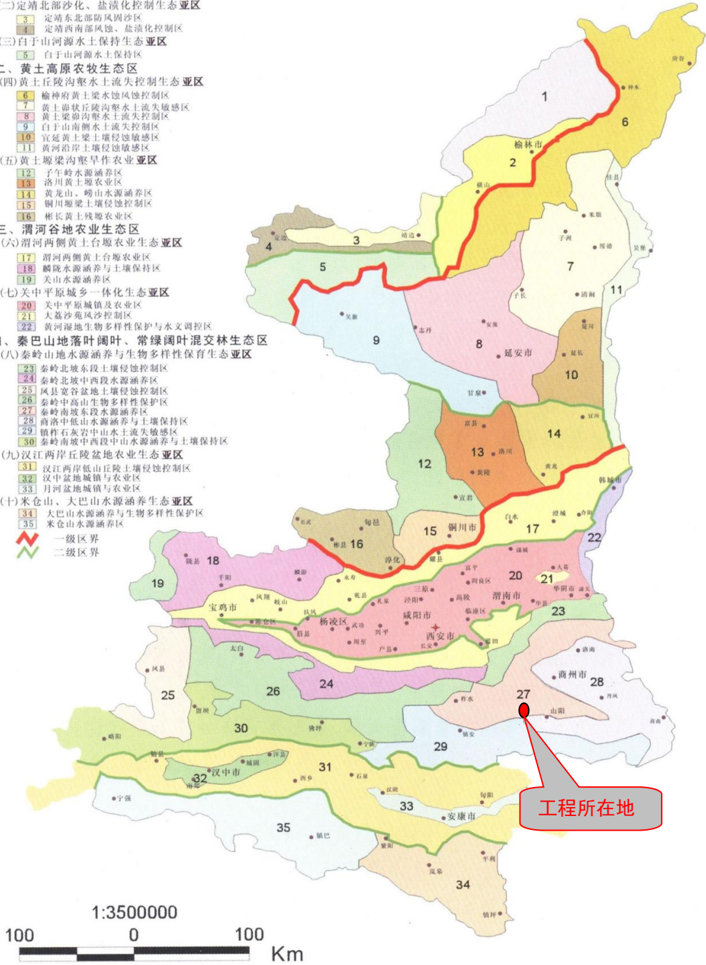
图 3-1 陕西省生态功能区划图